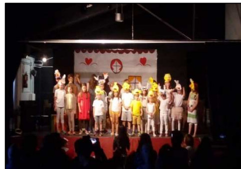
Le vilain petit cannard