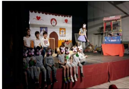
La souris vaniteuse