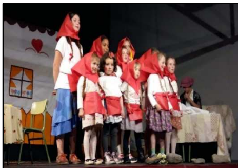
Le petit chaperon rouge