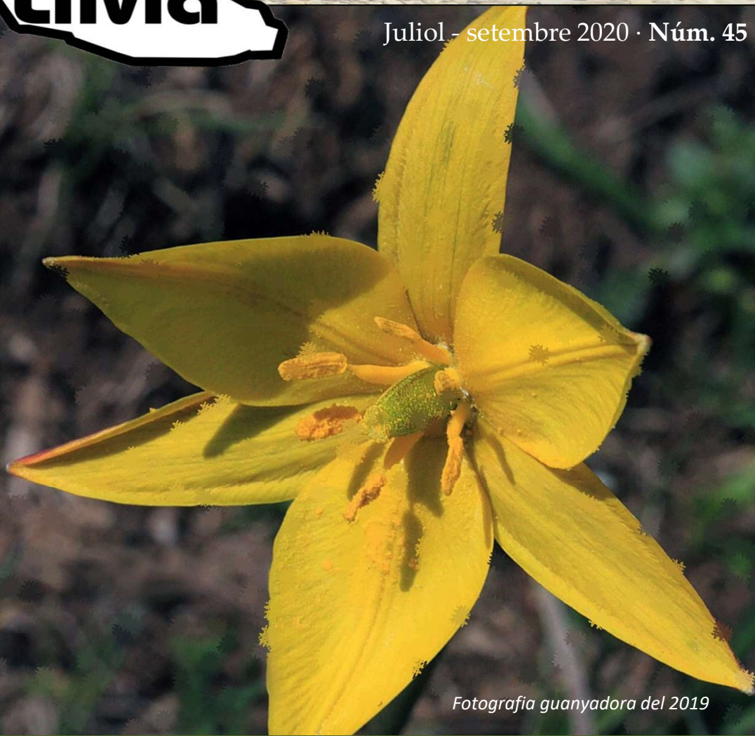
Fotografia guanyadora del 2019

L'ajuntament pren mesures econòmiques per ajudar a la ciutadania