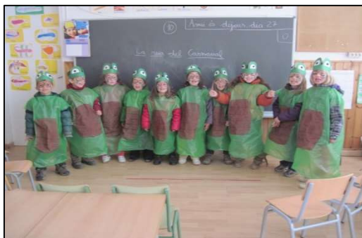
Nens i nenes de 6è quan feien P4