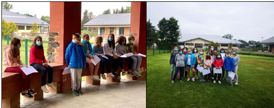
Les nenes i els nens de 6è de l’escola Jaume I