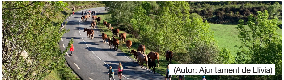
(Autor: Ajuntament de Llivia)

Enguany, l'Ajuntament de Llivia ha proposat alguns canvis importants com ara la contractació de dos guies de muntanya que faran l'acompanyament per aquelles persones que hi participen per primera vegada, tot facilitant informa-