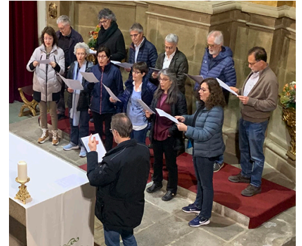
(Autor: Ajuntament de Llívia)

Des de l'Ajuntament de Llívia s'ha donat suport al projecte que busca la preservació d'aquest patrimoni llivenc.