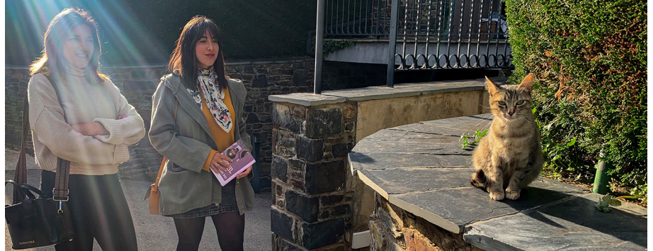
Les dues voluntàries, a la Pleta, miren la Minimixeta.

“El que fem inicialment és esterilitzar-los, per evitar així la proliferació. El gat és un animal molt net, però quan tens una sobrepoblació és un focus d'excrements. I hi ha un