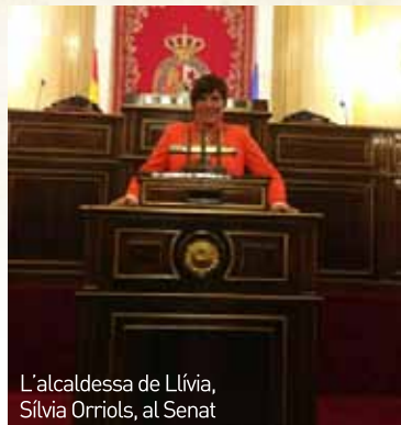
L'alcaldeessa de Llívia, Sílvia Orriols, al Senat

Tècnicament no era possible. La llei europea diu que “un ramader d'un estat membre de la Comunitat Europea no pot declarar terres d'un altre estat de la Comunitat Europea” . Tant els tècnics de la Generalitat com els del Ministeri d'Agricultura de Madrid deien que la llei era molt clara i no es podien acceptar les demandes que plantejava l'Ajuntament.