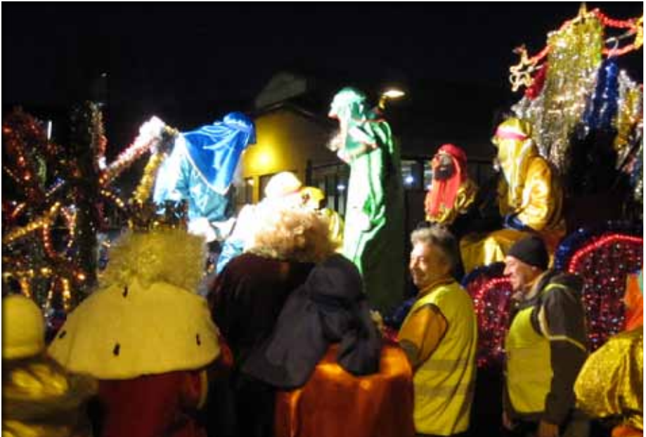
Rebuda als Reis d'Orient