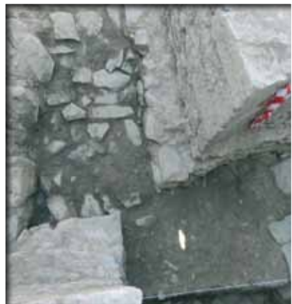
Vista de l'empedrat exterior a la torre sobre el qual s'hi recolza aquesta

Una de les conclusions extretes a partir d'aquests treballs és que la cronologia de la torre ve donada per la tipologia pròpia dels segles XII i XIII i pels materials arqueològics localitzats, tot i que al mateix lloc de la torre s'intueix una ocupació anterior amb presència residual de materials molt més antics, com de l'edat del Bronze.