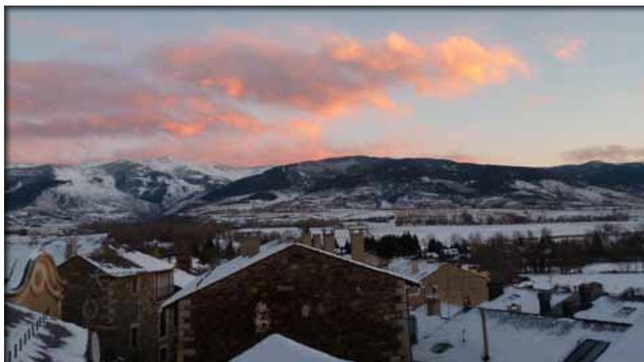
Primera nevada a Llivia.

En situació de risc imminent o durant la nevada, hom es port informar de les previsions meteorològiques i de l'estat de la xarxa viària i les rutes a seguir als mitjans de comunicació. I per qualsevol emergència es pot trucar al 112 .