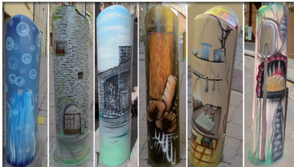
Diferents pilones personalitzades.

Una dotzena de pilones ja llueixen els elements que caracteritzen el comerç, i molt aviat en veurem dels particulars.