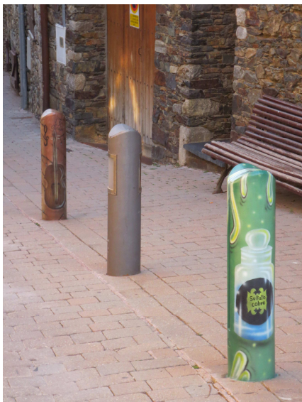
Pilones de disseny al carrer Raval