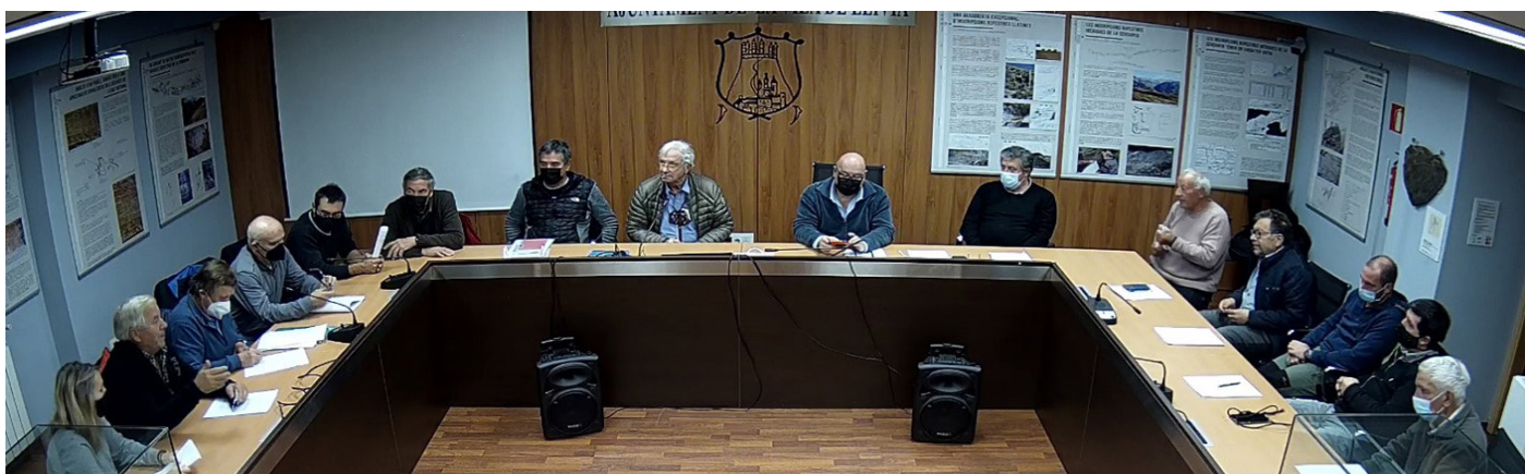
Reunió de la comunitat de regants a la sala d'actes de l'ajuntament.