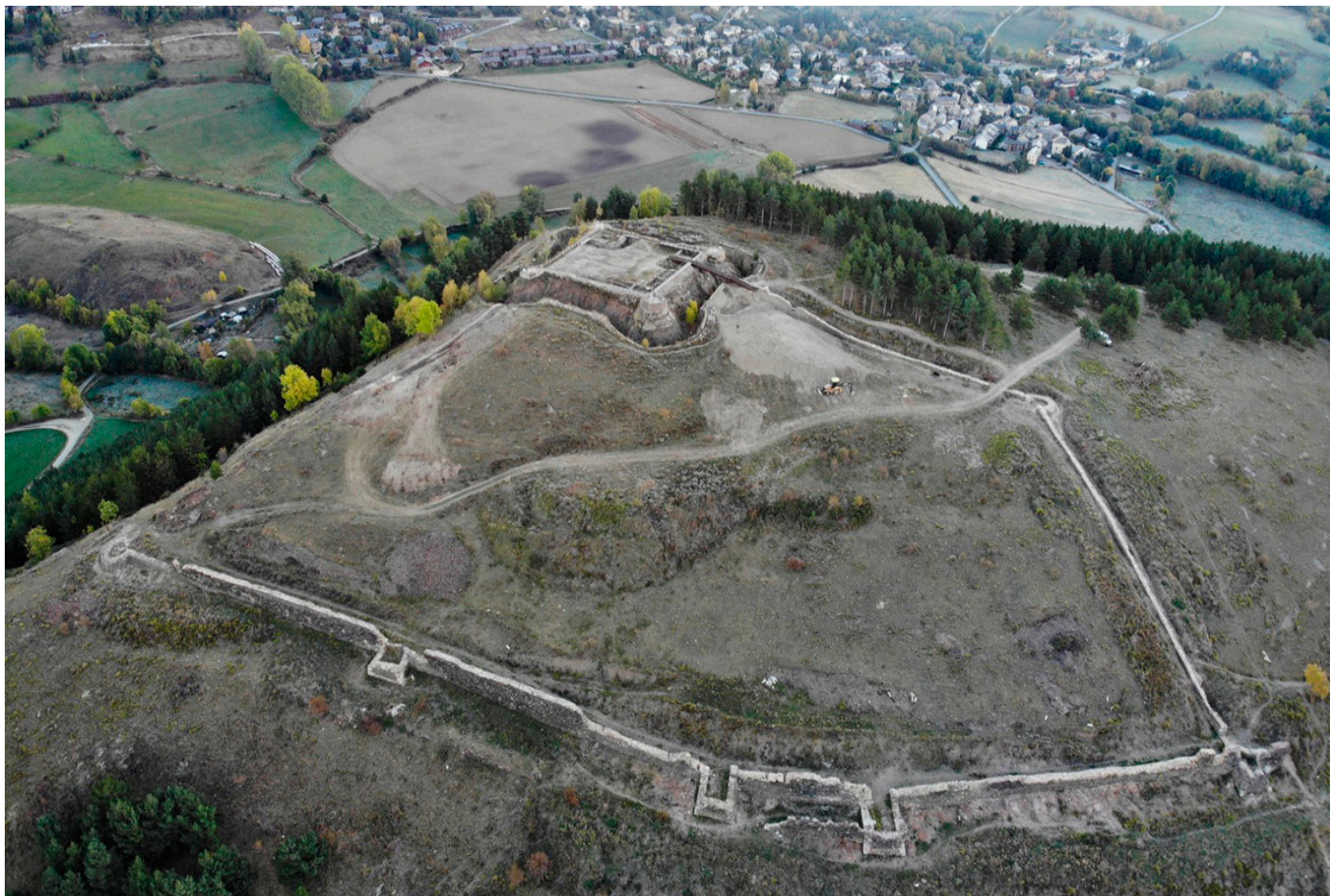
Vista aèria del conjunt del castell de Llívia.

Els arqueòlegs creuen, també, que cal retirar les terres acumulades de les excavacions anteriors