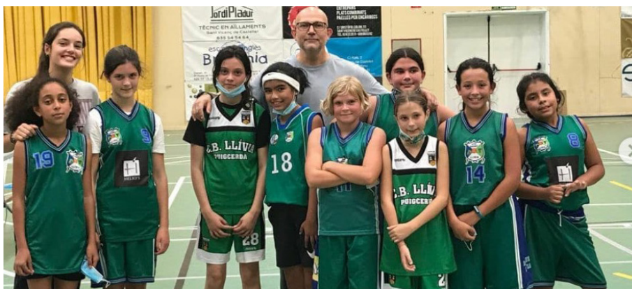
L'equip mini femení.

En masculí, la resta dels equips en competició són: cadet, infantil, preinfantil, mini i premini. En femení, el club presenta a