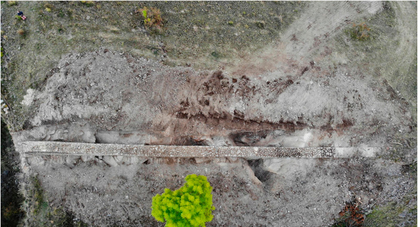
Vista aèria del fossat del castell antic. (Autor: Catarqueòlegs SL).