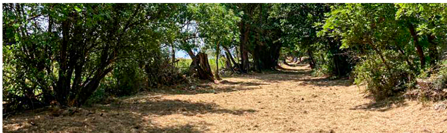
Un dels camins que s'han recuperat.

En aquesta fase s'actua a dotze camins: camí de Targasona, volta al turó del Castell pel riu d'Estaüja, enllaç del camí de