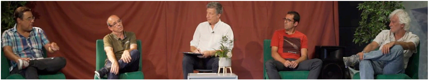
Moment del debat que es va fer a la sala del teatre de Llivia.

Durant la jornada, que organitza el Museu de Llivia, es va donar a conèixer un tractament exitós post-COVID que han dissenyat a La Solane, a Oceja