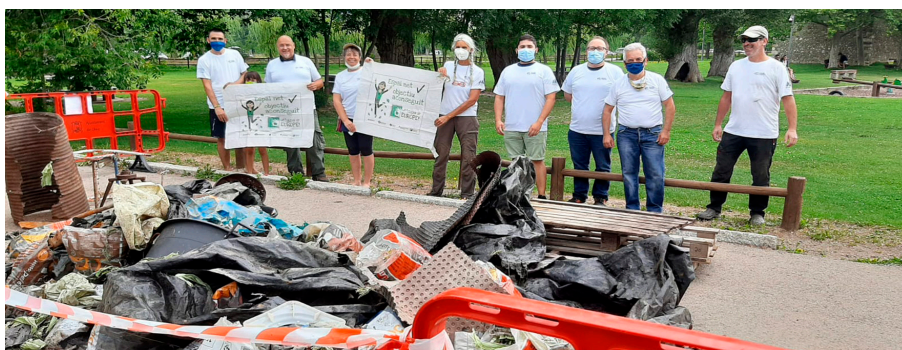
Alguns dels voluntaris amb els residus recollits. quilos de ferros i uns 10 de vidres. També es va trobar algun moble i altra ferralla.

L'associació Per una Catalunya Neta va calcular que s'havien recollit aproximadament uns 500 quilos de plàstic, uns 70