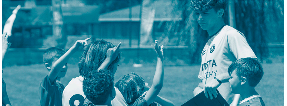
Imatge promocional. (Autor: Iniesta Academy)

L'Ajuntament de Llivia ha signat un conveni amb Iniesta Academy. És gràcies a aquest acord que tres joves del municipi podran participar, de forma gratuïta -a triar entre la primera o la segona setmana-, en el campus internacional Iniesta Academy (del 30 de juny al 6 de juliol i del 7 de juliol al 13 de juliol). L'Ajuntament sortejarà aquestes tres places entre tots els nois i les noies de Llivia que s'hagin inscrit.