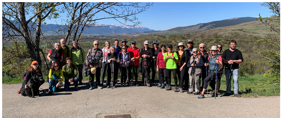
Fotografies de la presentació i la caminada del dia següent.

El Camí Ramader de Marina és un projecte que vol preservar, potenciar i promoure la ruta transhumant que ha permès el moviment de ramats