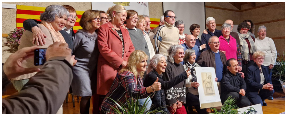
Moment del lliurament del guardó a Guils.

La Coral Capella Santa Maria de Puigcerdà ha estat guardonada en la present edició del Cerdà de l'Any. Alguns dels seus membres són veïns i veïnes de Llivia i l'Ajuntament ha volgut felicitar l'entitat per