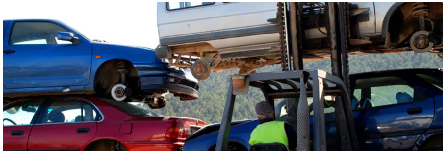
Cotxes a la planta de descontaminació de la Vall dan, a Berga.

El procediment per a retirar un vehicle abandonat de la