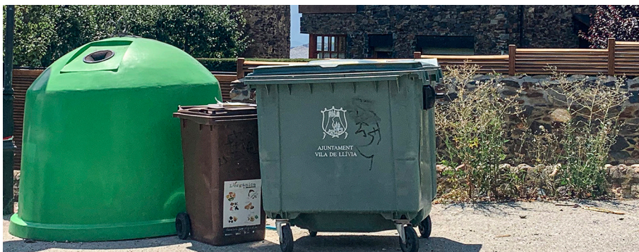
Contenidors a Llivia.

El Consell Comarcal de la Cerdanya és l'administració que gestiona el servei de recollida de deixalles a la comarca, Llivia inclosa. En l'actualitat, el concurs de licitació i l'adjudicació del servei s'ha de resoldre en un termini d'uns sis mesos. Des de l'Ajuntament de Llivia es considera oportú esperar aquest termini de temps, ja que l'empresa que es farà càrrec del servei renovarà la totalitat dels contenidors. L'Ajuntament de Llivia creu, doncs, que l'adquisició de nous recipients de brossa