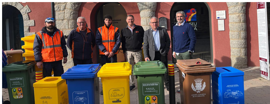
Lliurament del nou material a Llivia.

Aquesta és una campanya destinada a la millora de la gestió del reciclatge en es-