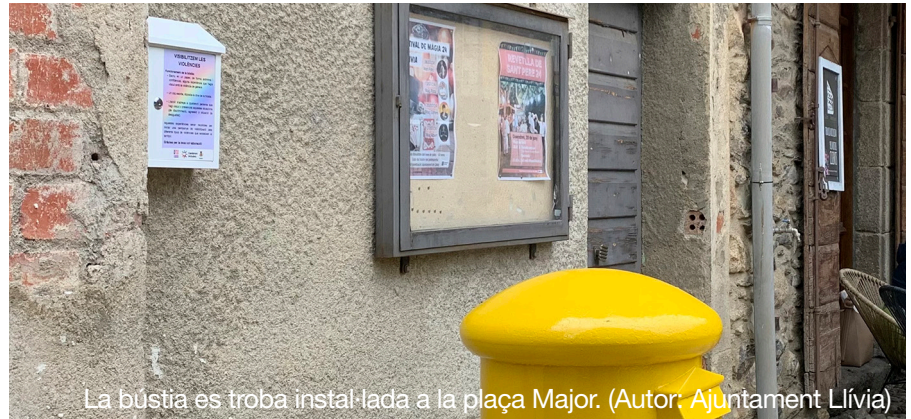
La bústia es troba instal·lada a la plaça Major.

Aquesta campanya consisteix en el desplegament de bústies (liles i irisades) repartides per la comarca de la Cerdanya, on es pot compartir de forma anònima a través del paper, les experiències en primera persona o del seu entorn. Experiències que s'hagin viscut o presenciats vers la violència o discriminació així com situacions de desigualtat.