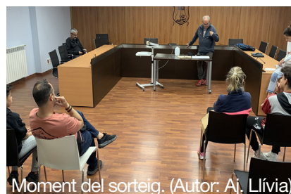
Moment del sorteig.

El passat 23 de maig, a les 18 hores, a la sala de plens de l'Ajuntament de Llívía, es va dur a terme el sorteig de les tres places gratuïtes del Campus Iniesta, estada que es farà del 30 de juny al 14 de juliol a la vila. Del total de participants en van sortir tres elegits que tindran la sort de gaudir de l'estada, de forma gratuïta. En el mateix sorteig es va triar, també, tres reserves, per si es