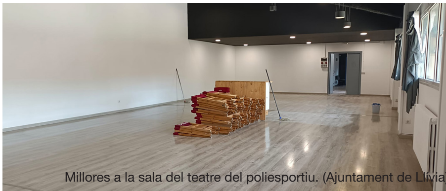
Millores a la sala del teatre del poliesportiu. (Ajuntament de Llivia)

Amb aquests diners s'ha fet i es farà, la pintura interior i exterior de la sala del teatre; la distribució obrada en petits magatzems de l'espai lateral de la pista de joc i també un parell d'espais tancats al túnel inferior de les grades de l'equipament esportiu. A més, s'han pogut adquirir quinze prestatgeries de càrrega de 3.500 quilos cadascuna, que serà per a endreçar el material escampat dins del túnel que hi ha al costat de la pista de joc.