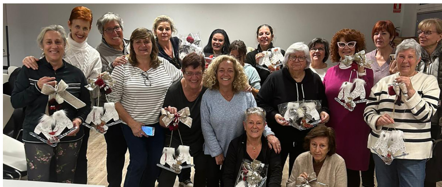
Diferents imatges de les dues activitats organitzades.