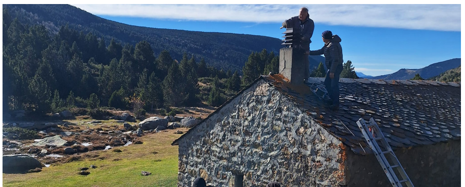
Reparació de la xemeneia del refugi.

des, pràcticament, el passat mes de juliol, però quedaven per fer algunes tasques, com ara la instal·lació de la llar de foc i la renovació de la xemeneia. Aquesta part