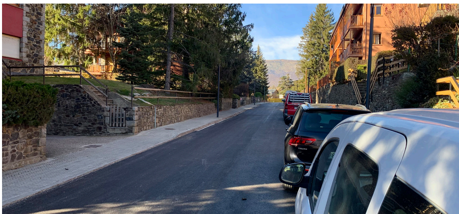
Fotografies d'alguns carrers arreglats, recentment.