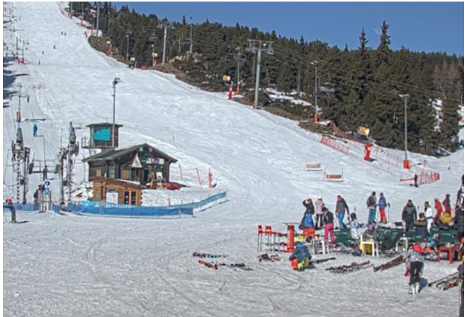
Imatge d'arxiu de l'estació d'esquí de Font-romeu.

novembre, el període de presentació de sol·licituds dels forfets amb descompte a l'estació d'esquí de Font-Romeu Pyrénées 2000. El termini finalitza el 15 de març de 2025.