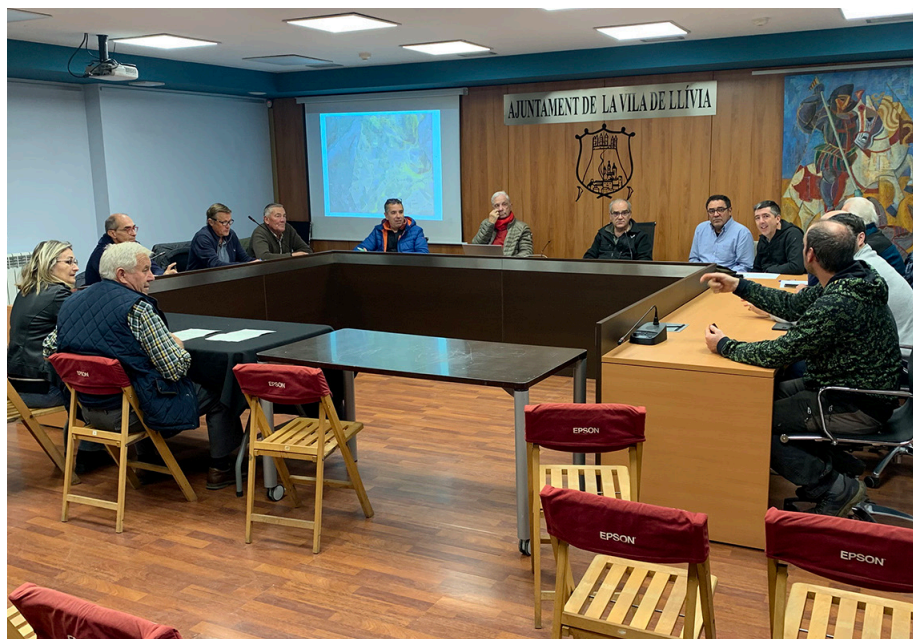
Fotografies de l'assemblea anual de socis.

seu tram a l'Alta Cerdanya, dins del terme municipal d'Angostrina, que rebrà una subvenció europea.