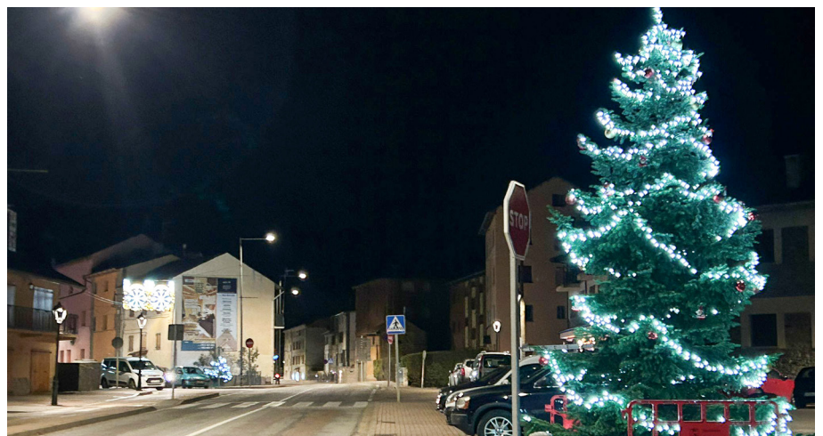
Alguns dels espais de Llivia, amb els avets il·luminats.

exemple el cas de l'entrada a Llivia, des de Puigcerdà, a la nit, amb els arbres il·luminats a peu de l'Avinguda Catalunya i al jardinet on hi ha ubicades les lletres Vila de Llivia, que produeix un clima ben