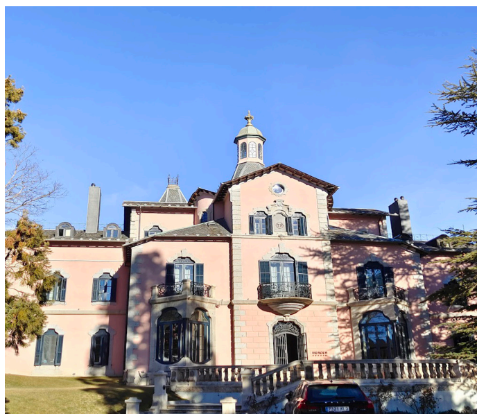
L'Ermita del Remei a Bolvir (1891), el Casino Ceretà de Puigcerdà (1893), la Torre de Riu a Alp (1896) i la Torre del Remei a Bolvir (1910).

quienes en vida dedicaron su inteligencia y sacrificaron sus bienes para el provecho espiritual e intelectual y progresos materiales de los habitantes de esta Villa y al morir legaron lo restante al mismo objeto. ¡Vecinos de Llívia! Jóvenes que os aprovecháis de este beneficio. ! Rogad por ellos! Fallecieron respectivamente en 25 de Febrero de 1920 y 28 de Marzo de 1923. RIP”