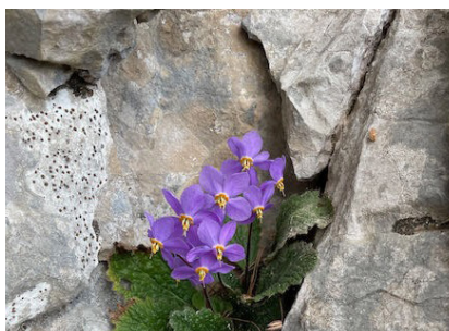
Les fotografies guanyadores del concurs del 2023. Mercè Escriu, Montserrat Doiz i Raimon Anglada

nic: grup@recercacerdanya.org , abans de l'11 d'agost de 2024.