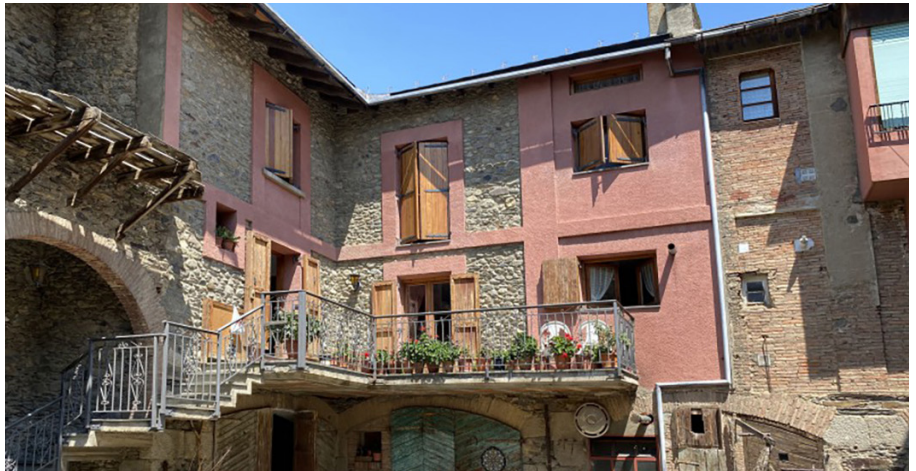
La casa Freixa, al carrer Raval de Llúvia

El seu estil arquitectònic s'ha classificat com a eclèctic, és a dir, un estil que recull influències d'altres corrents artístics per fer-ne una lectura personal que s'adapta als llocs i als encàrrecs. A la Seu construirà o reformarà edificis religiosos que lligaran perfectament amb el seu càrrec d'arquitecte diocesà del Bisbat i amb les seves creences. A la Cerdanya,