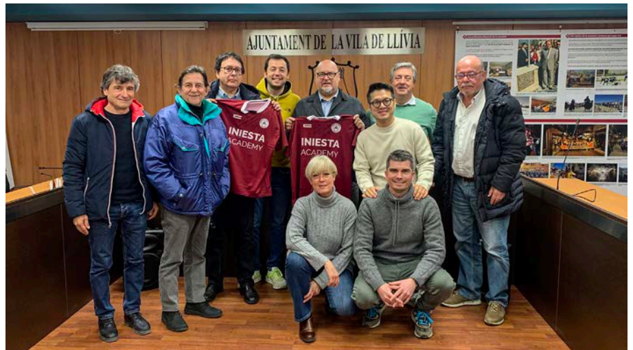
Presentació del Campus.

El futbolista internacional, ex-jugador del FC Barcelona i de la selecció nacional espanyola —i, actualment, a les files del Vissel Kobe—, Andrés Iniesta, organitzarà a Llívia (Cerdanya), el seu primer campus internacional a Catalunya. La concentració d'esportistes nacionals i internacionals —la Iniesta Academy Internacional Summer Campus— es farà durant els dies 2 al 15 de juliol del 2023, en què s'espera una inscripció superior als 100 futbolistes d'edats compreses entre els 8 i els 16 anys. L'esdeveniment esportiu es duu a terme mitjançant la Iniesta Academy, "el projecte personal d'Andrés Iniesta, que sorgeix de la seva pròpia motivació per acostar-se a la formació dels nens i de tornar a la comunitat del futbol