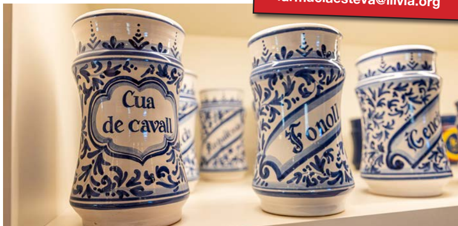
Imatges de la botiga del museu. (Autor: Joan Reyes)

Contacte: tel. 972 896 313 museu@llivia.org i farmaciaesteva@llivia.org