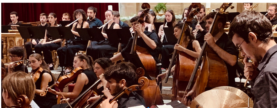
Actuació de l’OSTO, l’any passat, a Llívia.

L’OSTO és una orquestra simfònica formada per alumnes i exalumnes de l’ESMUC.