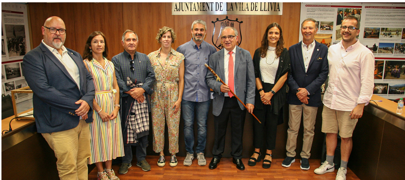
Els nous membres del consistori de Llivia, després d'aquestes últimes eleccions.

Els regidors prenen possessió del seu càrrec, en el ple del passat 17 de juny. El consistori estarà format per sis regidors de Fem Llivia, dos de Per Llivia i un de Junts Futur Llivia