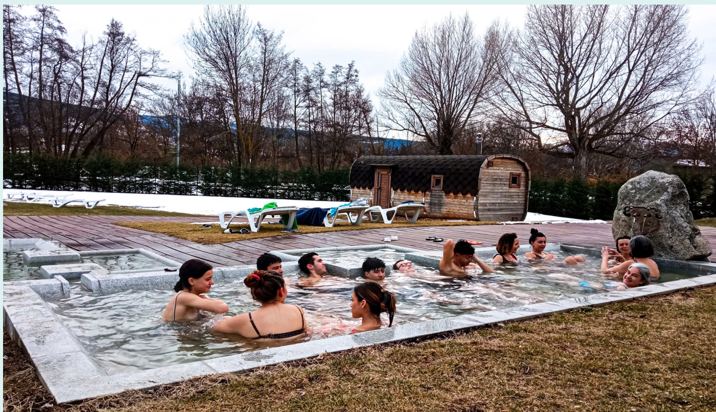
Diferents imatges dels banys termals de Llívia.

Els banys termals de Llívia són l'última incorporació a l'oferta de banys termals de la Cerdanya.