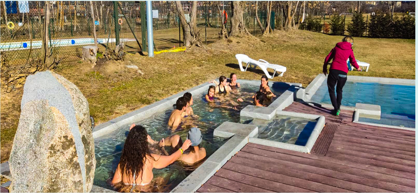
Diferents imatges dels banys termals de Llivia.

Les instal·lacions s'han obert, en fase de proves, aquest mes de gener