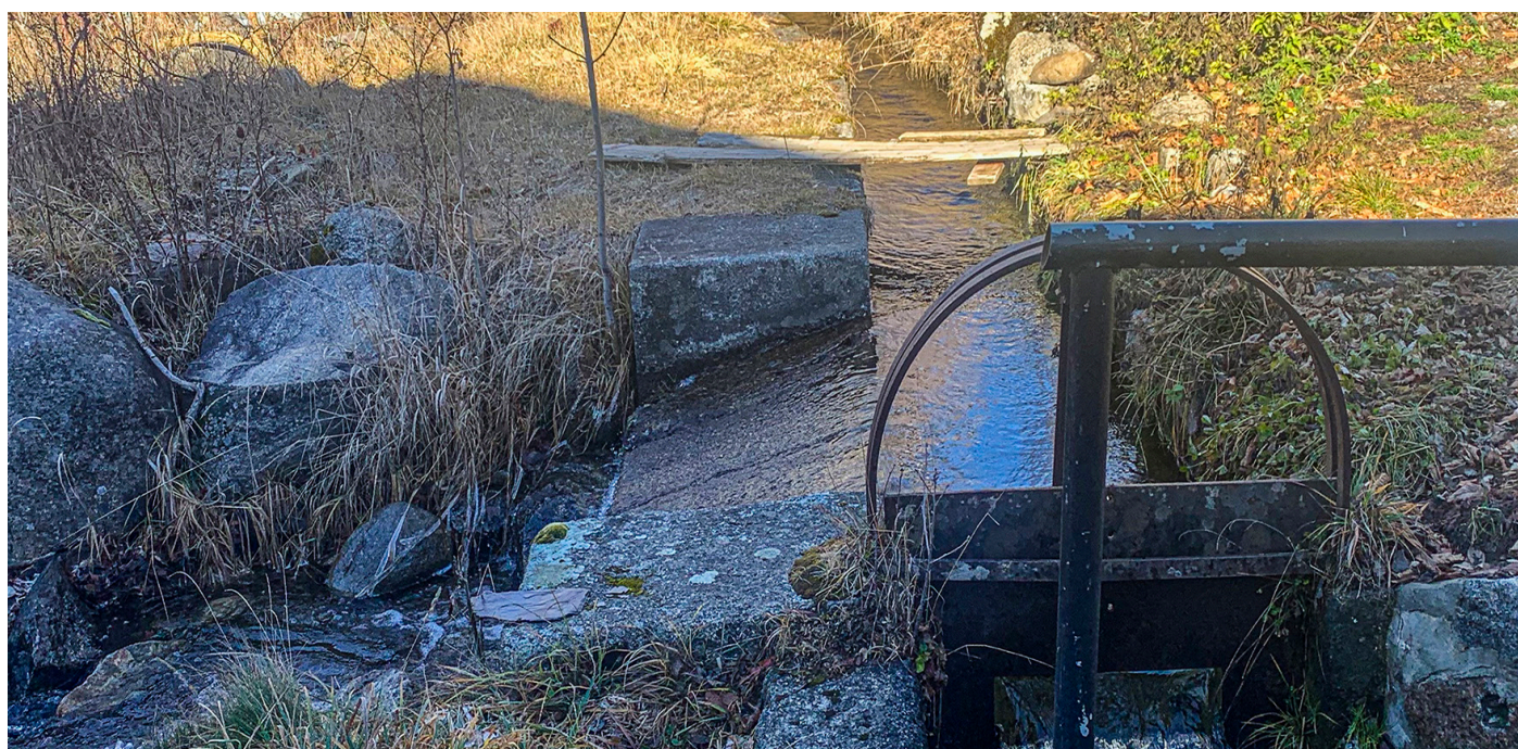
Fotografia superior, reunió de la comissió. A sota, la captació a Angostrina.