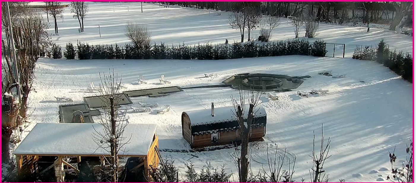
Diferents imatges dels banys termals de Llívia.