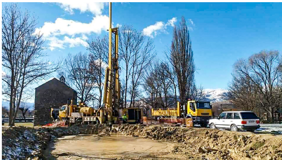
Treballs a Sant Guillem, any 2019.

El consum d'aigua a Llivia —aquell que és sabut pel coneixement que hi ha de les dades que revelen els comptadors de la xarxa municipal— és, actualment, d'uns 186.000 metres cúbics a l'any. Les dues captacions actuals del municipi —riu d'Er (dipòsit de Gorguja, des d'on es garanteix el 80% del subministrament total) i canal