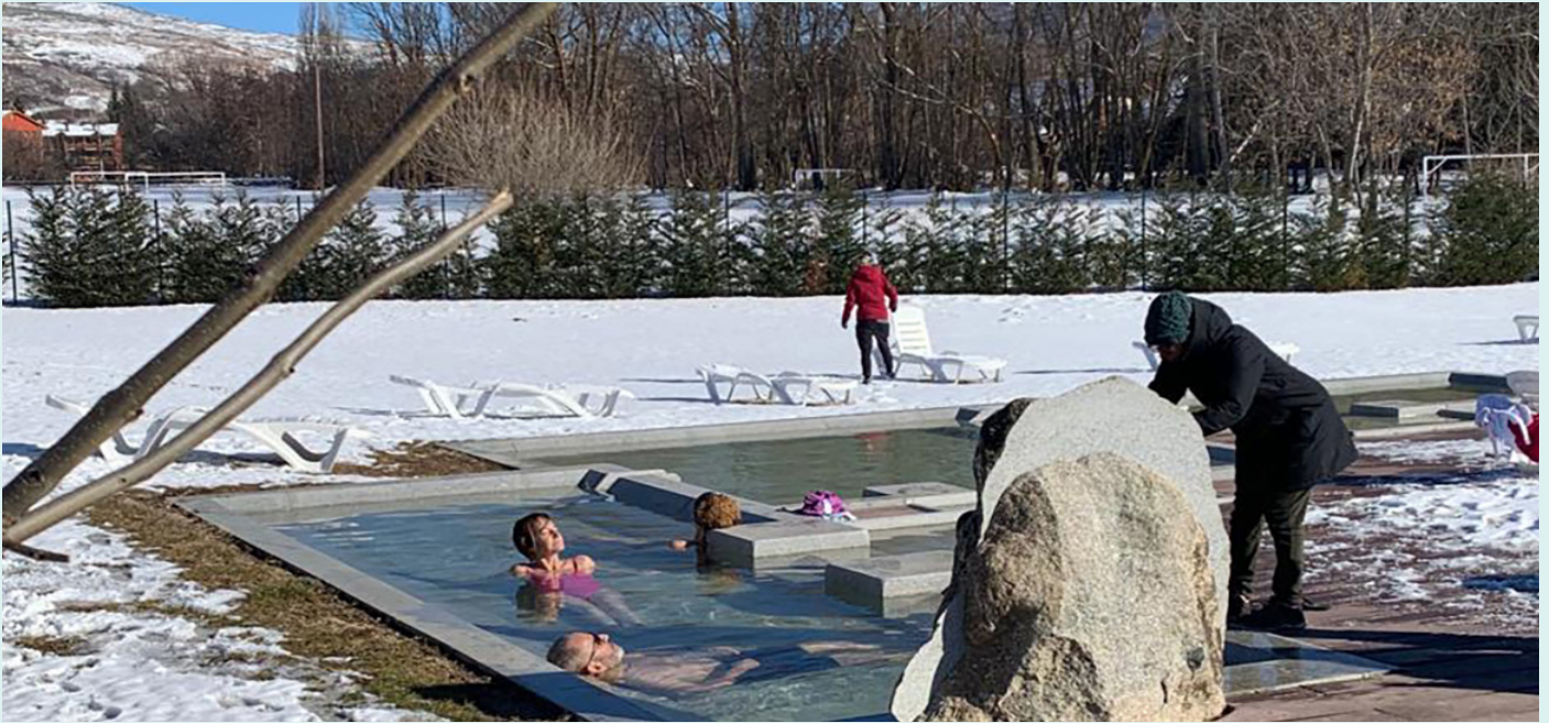
Diferents imatges dels banys termals de Llivia. (Autor: Ajuntament de Llivia / J.P.V.)

A través de l'estudi de l'àrea d'influència dels serveis termals que hi ha a la comarca o en zones properes, es podria considerar que la instal·lació de Llivia podria arribar a assolir les xifres d'assistència de Dorres, si més no de manera progressiva durant els primers anys de funcionament. Així, amb aquesta anàlisi, més l'obertura prevista, i tot valorant que la xifra mitjana de visitants podria ser d'uns 4.800 usuaris / mes —en l'escenari menys optimista—, l'estudi determina que els ingressos totals que generaria l'activitat puja-