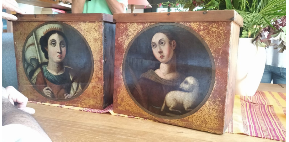
Les dues caixes, en mans dels hereus Esteva. (Museu de Llívia).

Un estudi encarregat pel Museu de Llívia a l'Institut Català de Recerca en Patrimoni Cultural (ICRPC) ha remarcat el valor del conjunt del mobiliari de la farmàcia Esteva de Llívia, destacant la seva excel·lència i els elements que el fan singular en el context patrimonial de l'època del Barroc a Catalunya i a Espanya.