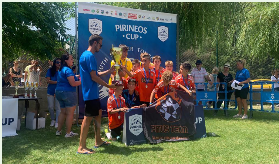
Un dels equips participants a la Pyrenees Cup.

En general, les instal·lacions gaudeixen d'una bona valoració per part dels esportistes. Aquest últim any, Llívia ha acollit, pel que fa a la competició, els campionats Universitaris, i edicions de la Pyrenees Cup i la Cerdanya Futsal, entre altres.