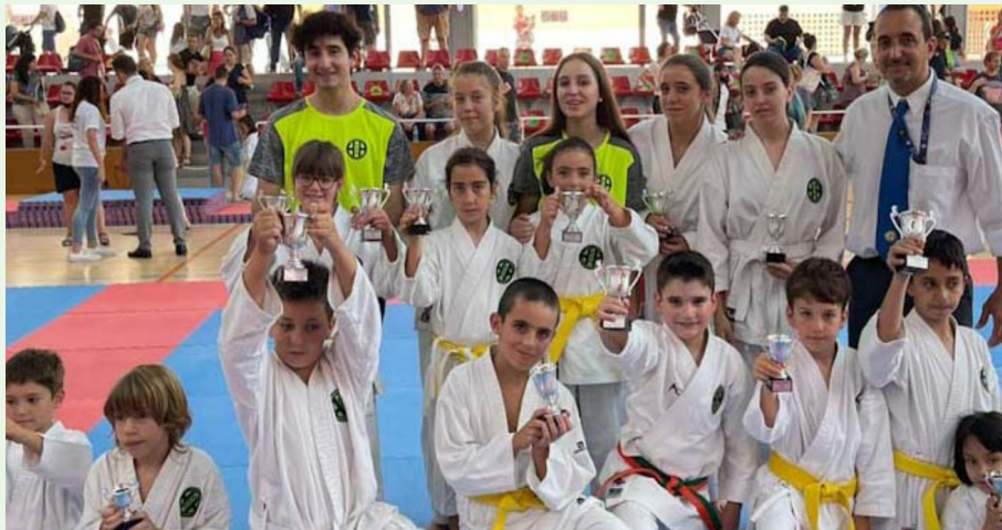
Alguns dels esportistes que es formen al Club Karate Llivia. (Entitat)

El curs esportiu comença amb 70 alumnes inscrits i quatre grups de formació