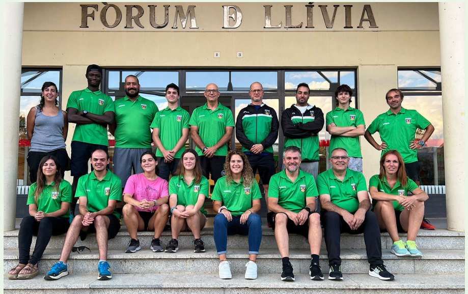
L'equip de tècnics del Club Bàsquet Llivia-Puigcerdà, aquest 22-23.

Senpau ha valorat positivament el suport d'empreses i comerços comarcals, de les quotes de les famílies i del suport institucional que fa possible el projecte esportiu. L'equip juga els seus partits als pavellons de Llivia i de Puigcerdà.