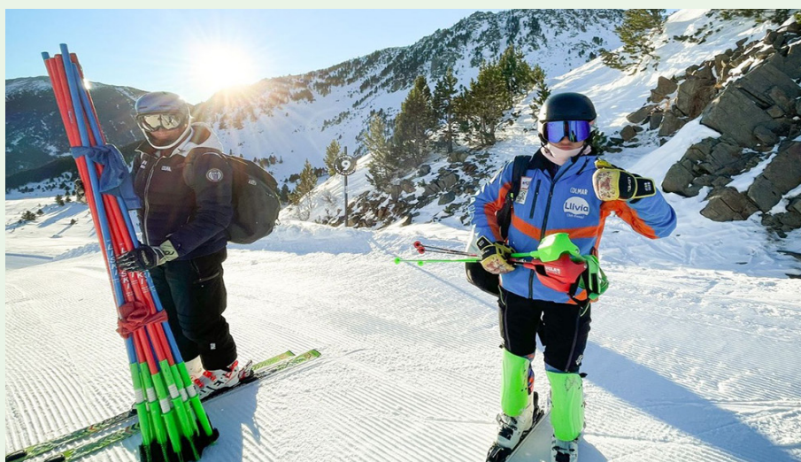
Imatges d'esquiadors del club, cedides per l'entitat.