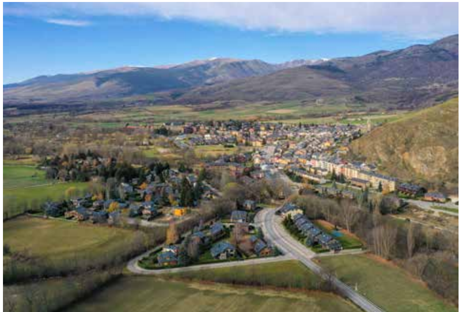
Fotografia aèria de Llivia.

tació pública del POUM en la que hi van assistir una trentena de veïns i veïnes.