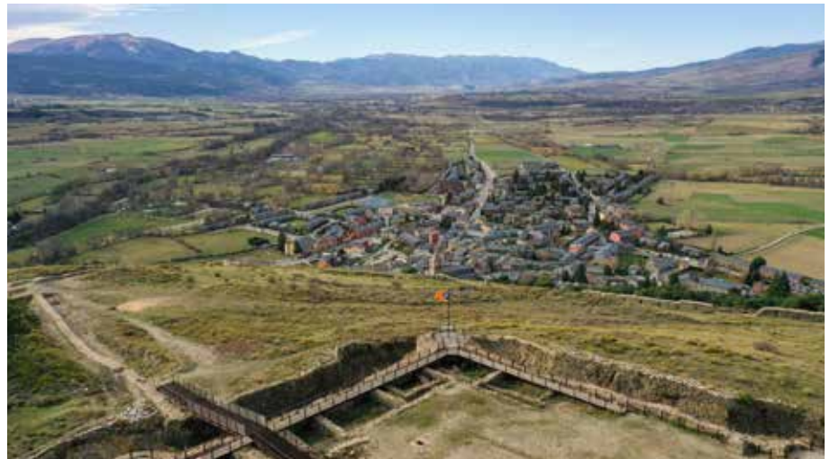
Vista general de la vila, des del castell.

En el cas de Llivia, el nou pla revisa un planejament en vigor des de l'any 1986 i garanteix que el model d'implantació urbana s'ajusta escrupolosament a les determinacions del planejament territorial, potenciant els valors que identifiquen actualment als assentaments del municipi. En aquest sentit, el pla dimensiona els creixements estrictament necessaris seguint un model més compacte