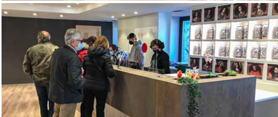
Fotografies de com ha quedat el nou espai. L'última imatge, un dels primers dies de reobertura.

reformant els espais museogràfics. El canvi del mobiliari també ha implicat un nou el paviment i s'ha renovat la il·luminació.