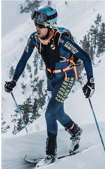
Aubach, campió de Catalunya per equips d'Esquí de Muntanya

A més, Llivia ha acollit en pocs dies, diferents proves com ara el Campionat de Catalunya d'Universitaris o el pas de la Volta Ciclista a Catalunya.