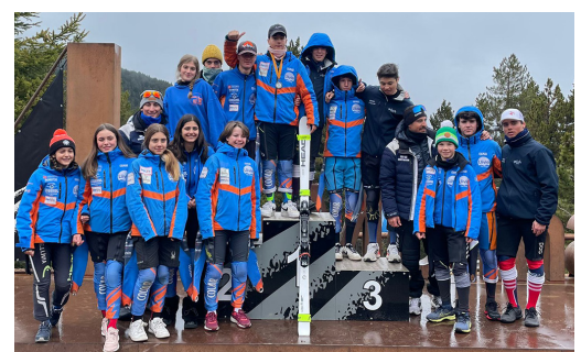
Esquiadors del CE Llivia.